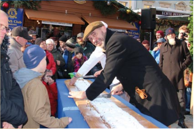
Stollenschnitt 2017